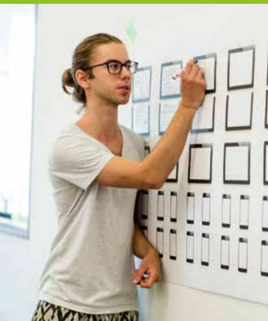
UX Mapping Workshop zur Konzeptentwicklung

Das duale Studium verbindet zukunftsorientiert ein Studium mit der Praxis. Die Tech-Branche eignet sich dazu in besonderer Weise für das duale Studienkonzept. Aktuelle praktische Erfahrungen und Kompetenzen sind fundamental für den beruflichen Erfolg der Studierenden. Durch die kontinuierliche Verschmelzung von theoretischen Phasen an unserer Hochschule und Praxisphasen im Unternehmen transferieren Studierende im dualen Studium akademische Inhalte direkt in die Praxis. Nach Abschluss des dualen Studiums sind die Absolventen umfassend für künftige Fach- und Führungsaufgaben im Unternehmen vorbereitet.