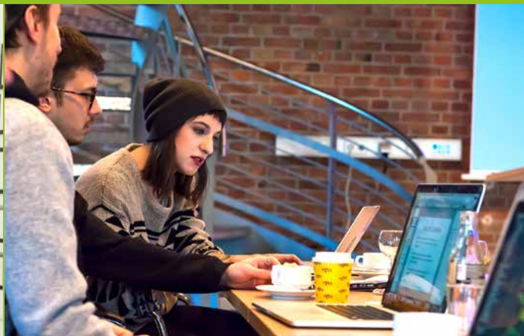
Studierende im Kickoff-Workshop im Unfallkrankenhaus Berlin (ukb)